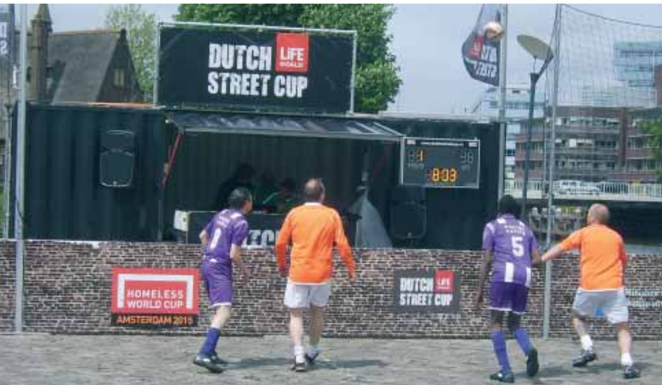
Voetballer uit de teams van Groningen en Twente/Enschede strijden om de overwinning op het Rodetorenplein in Zwolle

'Mogen we ook even meedoen?' Een paar dak- en thuislozen gebaren naar het speelveldje op het Rodetorenplein in hartje Zwolle waar de Dutch Street Cup wordt gespeeld. Ze zijn hier om het Zwolse team aan te moedigen. Als ze elkaar de bal toespelen, voegen een paar spelers van team Zwolle zich bij hen. Even is er geen verschil tussen spelers en toeschouwers. Dutch Street Cup Zwolle is één groot team van solidariteit en verbondenheid. 'Dit beeld zal me het hele toernooi bijblijven. Het is de Dutch Street Cup ten top', aldus de organisator.