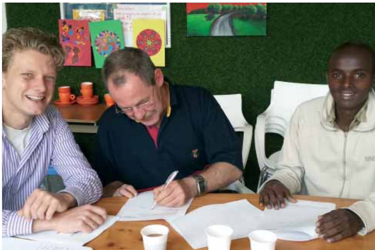
Ondertekening contract door twee nieuwe medewerkers van Pauropus als uitloeiisel van de activiteitenmarkt.

inloopspreekuur gaat houden om met daklozen mee te denken over toekomstplannen en talentontwikkeling. Zij zal nog meer daklozen toeleiden naar passend betaald werk, vrijwilligerswerk of zinvolle vrije tijdsbesteding.