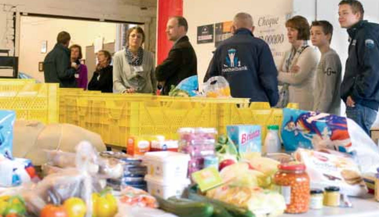
Belangstellenden krijgen uitleg over de Zwolse Voedselbank tijdens Open Dag.