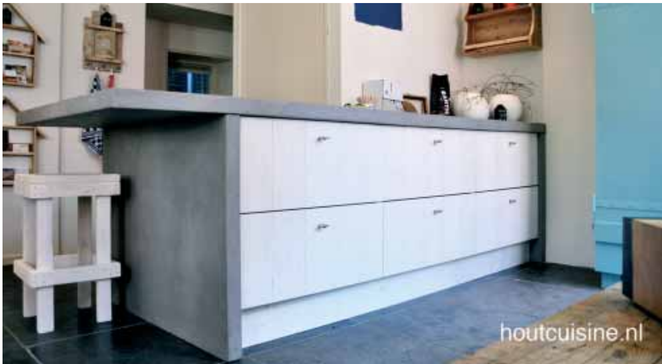
De koffie to go corner in het pand van Huishout

Cliënten die aan de slag willen bij bedrijven via Bureau Opstart vullen een persoonsprofiel in.