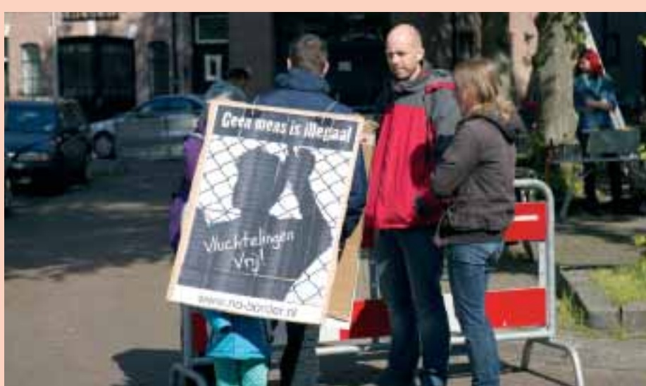
In Zwolle werd er ook gedemonstreerd tegen het illegalenbeleid