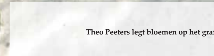
Theo Peeters legt bloemen op het graf