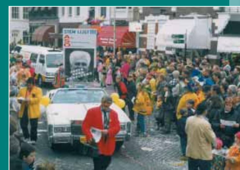
Tijdens de carnavalsoptocht in Zwolle met een wagen met "Joop for president"