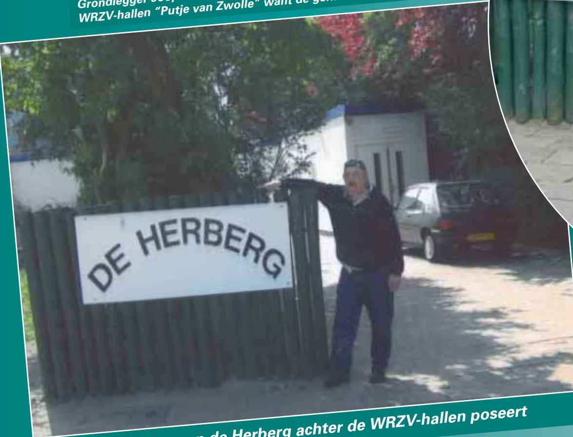
Een bewoner van de Herberg achter de WRZV-hallen poseert