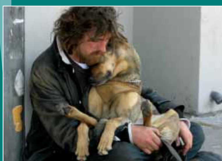
Bewoner en trouwe viervoeter wisten hun plek te vinden in de Herberg