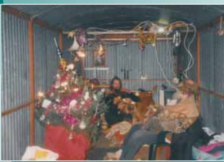
Bewoners achter de WRZV-hallen hadden hun onderkomen in kerstsfeer gebracht