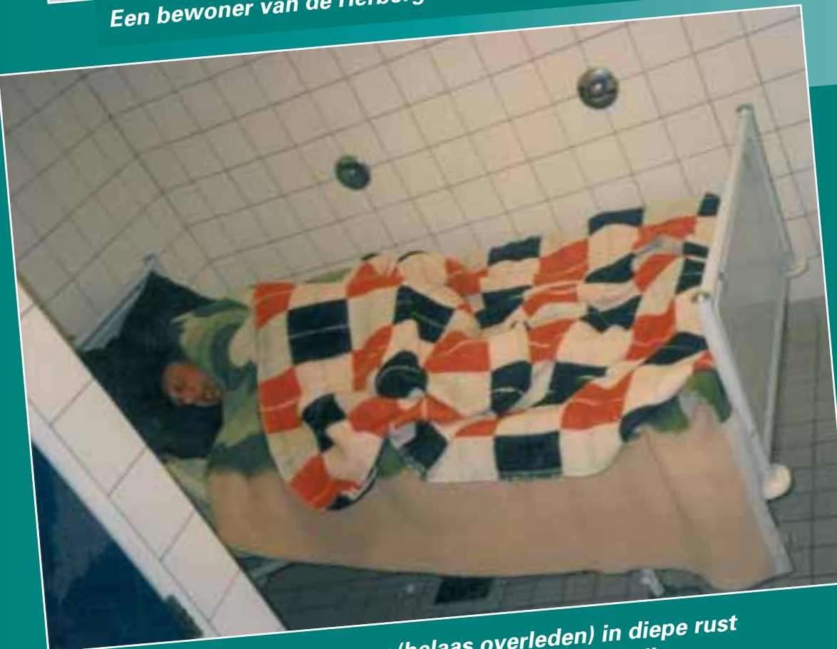
Bram een vaste bewoner (helaas overleden) in diepe rust onder de wol in de kleedkamer van de WRZV-hallen