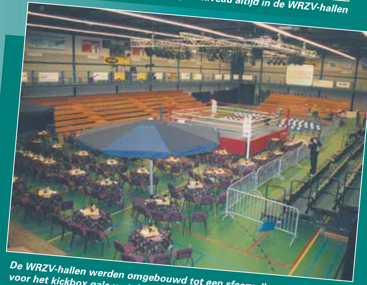
De WRZV-hallen werden omgebouwd tot een sfeervolle sportarena voor het kickbox gala wat door velen werd bezocht