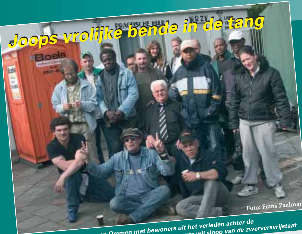
Joops vrolijke bende in de tang