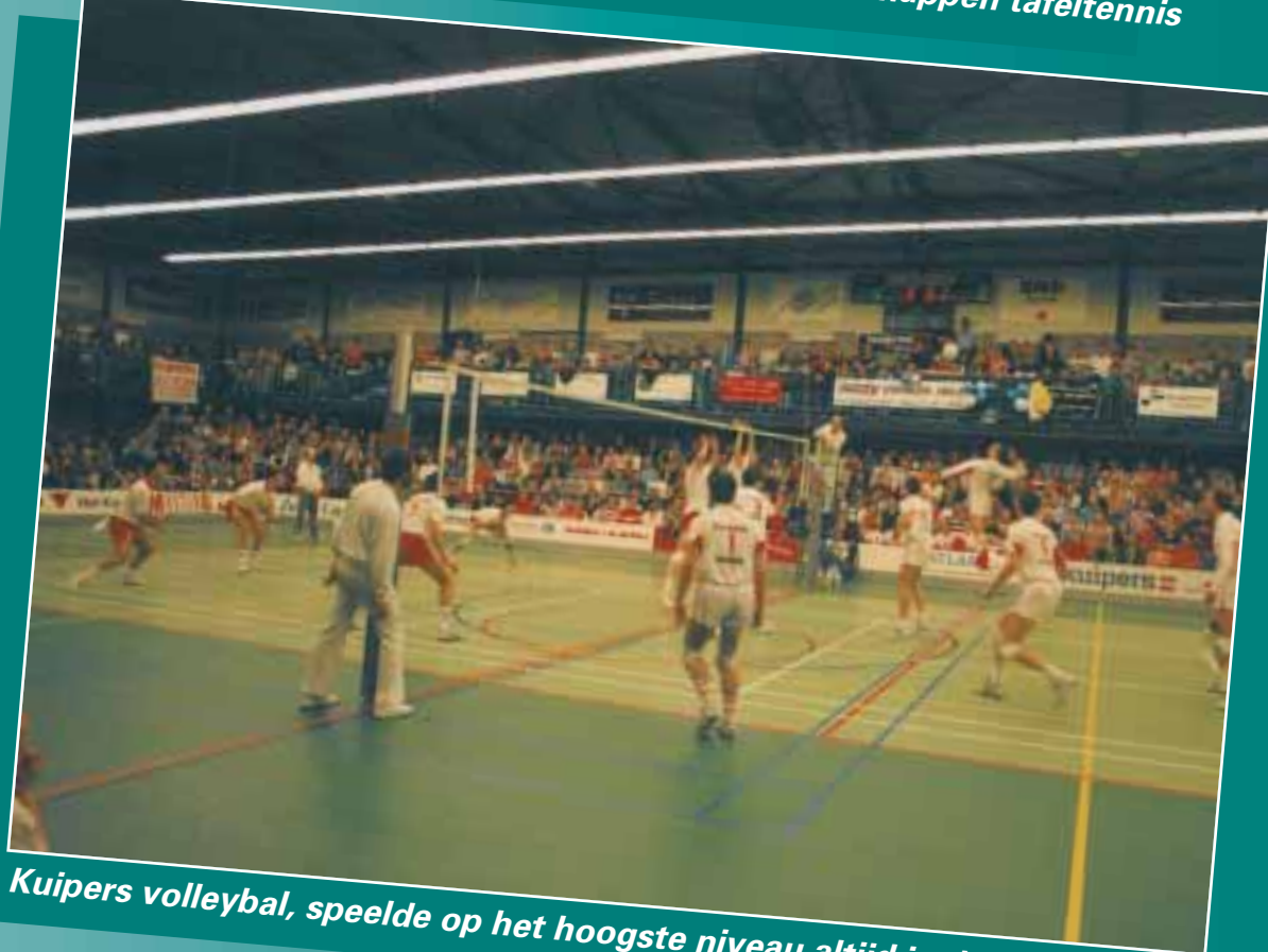
Kuipers volleybal, speelde op het hoogste niveau altijd in de WRZV-hallen